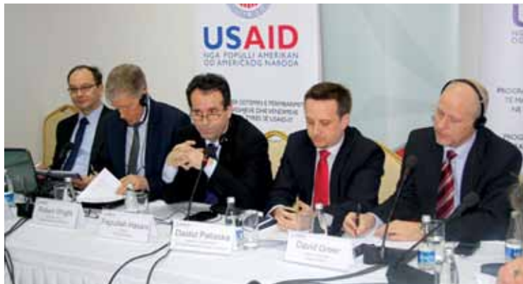
Tryezë e rrumbullakët - Hipoteka si titull ekzekutiv

Programi BAB (Bazat e Afarizmit Bankar) është program i certifikimit në njohuri themelore bankare, i ngritur nga Rrjeti Evropian për Trajnime Bankare (European Bank Training Network, EBTN). I mbështetur dhe i menaxhuar nga vetë sektori bankar i Kosovës, programi Bazat e Af-