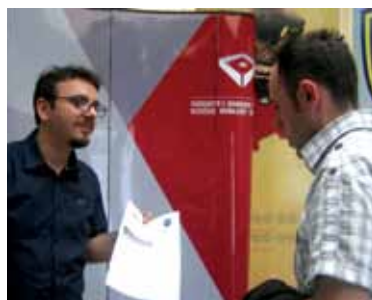
SHBK Merr Pjesë në Panairin e Karrierës

arizmit Bankar - BAB, i akredituar në bazë të standardeve të EFCB (European Foundation Certificate in Banking), aftëson dhe certifikon personat për njohuri fundamentale në banka, me qëllim që të kenë njohuri dhe përparësi me rastin e aplikimit për punë në banka. Akreditimi nga EBTN mundëson që këto certifikata të njihen dhe të përdoren në shtetet evropiane, disa prej të cilave veç e kanë adaptuar programin EFCB. Më datën 19 mars 2012, filloi grupi i parë i këtij programi i përbërë nga zyrtarë të bankave të cilët janë pjesë e departamenteve të ndryshme, si: analistë të kredive, këshilltarë për klientë, arkëtarë, specialistë të burimeve njerëzore, zyrtarë për kartela, zyrtarë për marrëdhënie me korporata, zyrtarë për klasifikim të aseteve, pjesëmarrës nga programi për bankierë të rinj, e kështu me radhë. Më datën 25 prill 2012, përfundoi kursin grupi i parë për Certifikimin EFCB, apo Bazat e Afarizmit Bankar, dhe iu nënshtrua provimit të certifikimit më 19 maj 2012. Në fund të kursit 15-ditor, pjesëmarrësit i shprehën se ky tra-